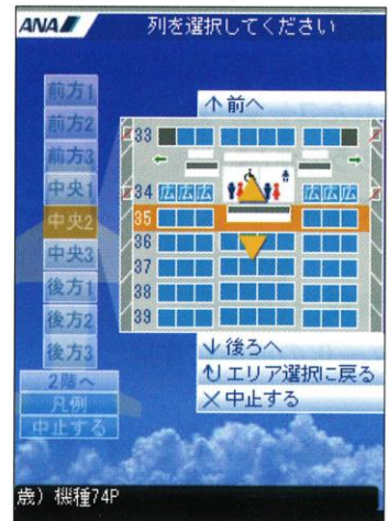
全日本空輸の国内線座席指定ページ