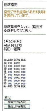
従来の座席指定ページ

テキストベースの座席指定ページでは、どの環境にある席を指定したのか伝えられない点に課題があった (HTML版はFLASH未対応機種用)。