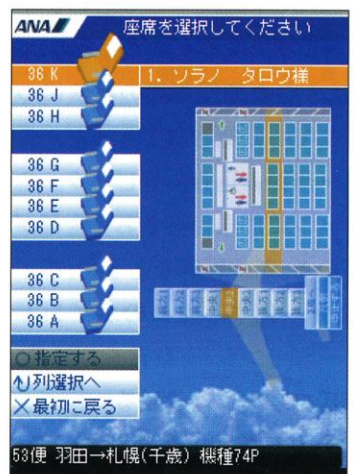
全日本空輸の国内線座席指定ページ

「どのように配置したらユーザーが見やすく・使いやすいページになるのかを考えると難しくなった」と岡氏。